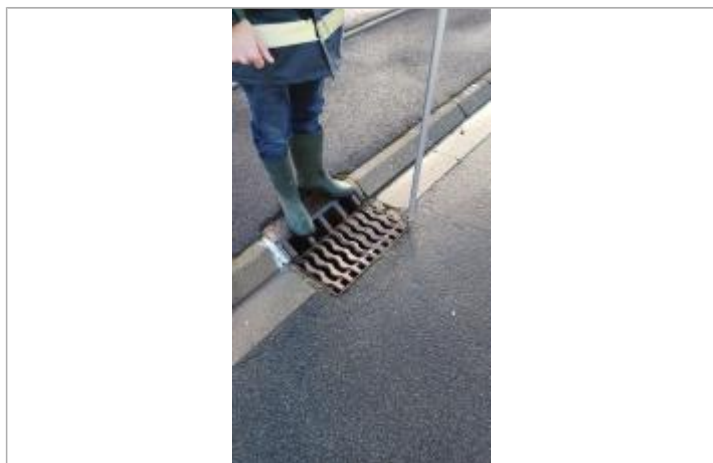
Dépôt de débris de végétation au niveau de la grille d'évacuation.

NIVELLEMENT SPC SACN. LE SPC N'EST PAS GÉOMÈTRE EXPERT, LES COTES SONT DONNÉES À TITRES INDICATIF. - 09/12/2021