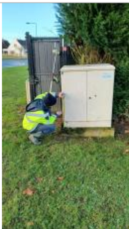
Laisse de crue sur armoire électrique à 34 cm/socle en béton de l'armoire.

Altitude calculée de l'eau (en m) : 21.542 m