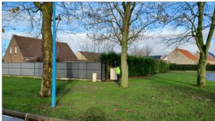
Armoire électrique située à l'angle de la rue de La Perche et du "Domaine des Iris"