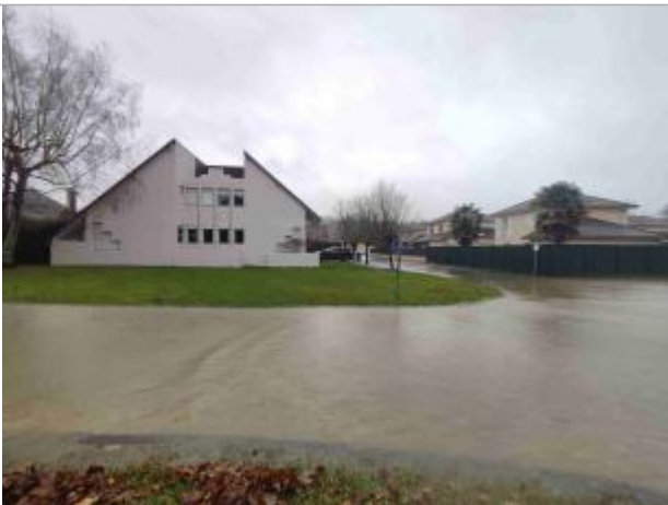
Vue du repère durant la crue

Type de repérage : Observations en cours d'événement