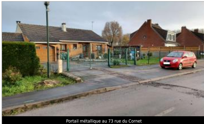
Portail métallique au 73 rue du Cornet