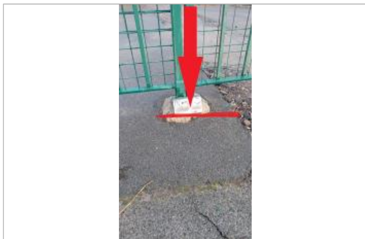
L'eau a atteint le seuil du portail

NIVELLEMENT SPC SACN. LE SPC N'EST PAS GÉOMÈTRE EXPERT, LES COTES SONT DONNÉES À TITRES INDICATIF. - 09/12/2021