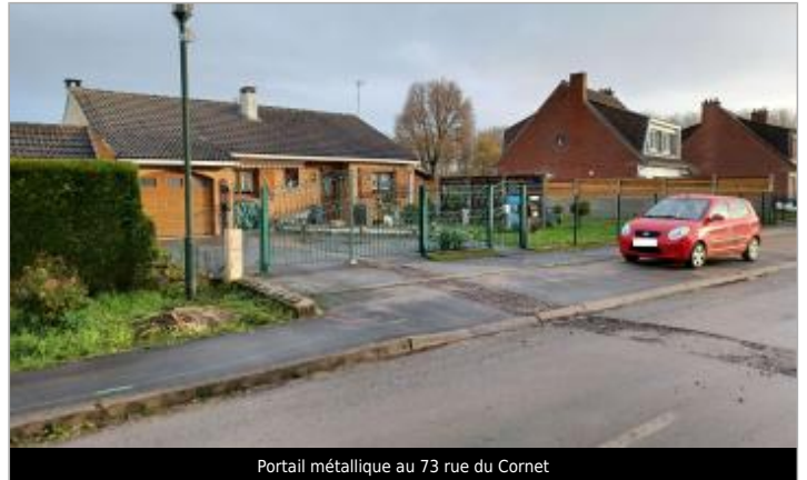
Portail métallique au 73 rue du Cornet