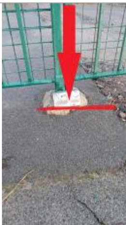
L'eau a atteint le seuil du portail

Altitude calculée de l'eau (en m) : 21.477 m