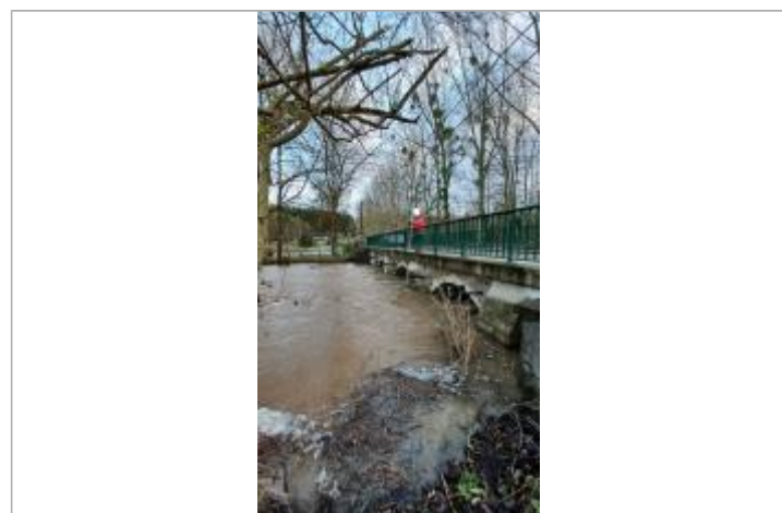
Mesure du niveau de l'eau à la verticale du Pont.

MARQUE Maximum de l'inondation : Non Visibilité : Non État du repère : Disparu Pérennité : Aucune