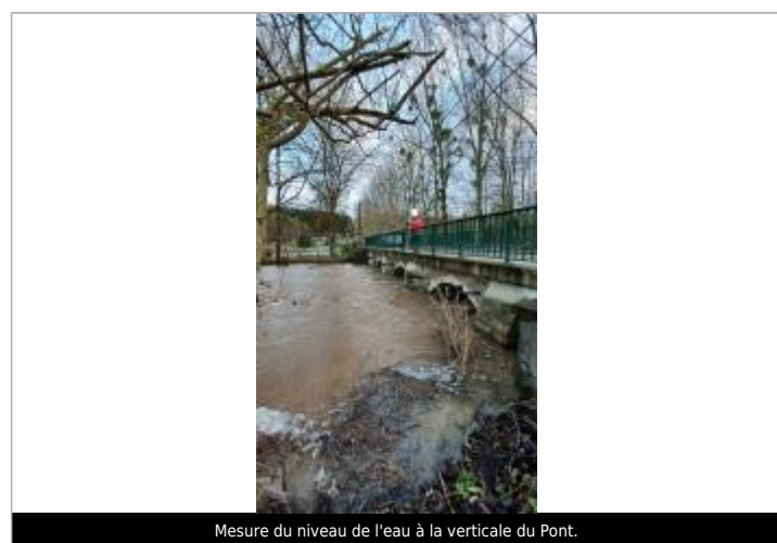
Mesure du niveau de l'eau à la verticale du Pont.