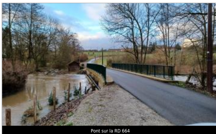
Pont sur la RD 664

GÉOLOCALISATION Coordonnées WGS84 : X: 0.67992863 / Y: 48.78788400 Coordonnées RGF93 (Lambert 93) X: 529567.71 / Y: 6856703.64 Coordonnées RGF93 (ETRS89) : X: 0.6799286 / Y: 48.787884 Code Hydro: H6--0200 Rive de référence: Non renseigné