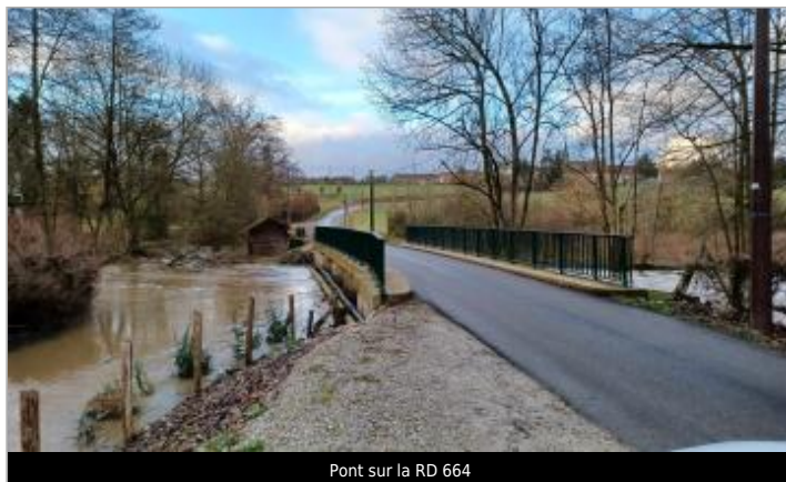
Pont sur la RD 664