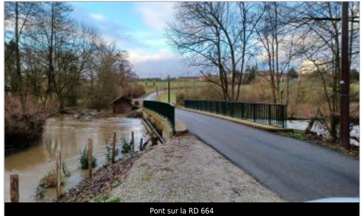
Pont sur la RD 664

Coordonnées WGS84 : X: 0.67992863 / Y: 48.78788400