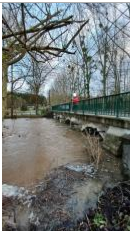
Mesure du niveau de l'eau à la verticale du Pont.

Altitude calculée de l'eau (en m) : 186.64