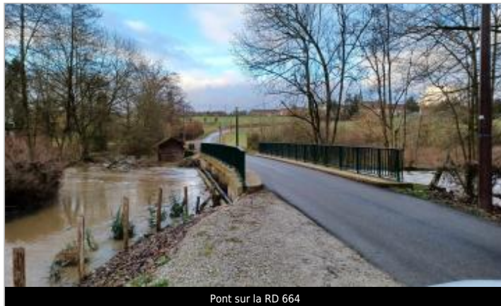
Pont sur la RD 664