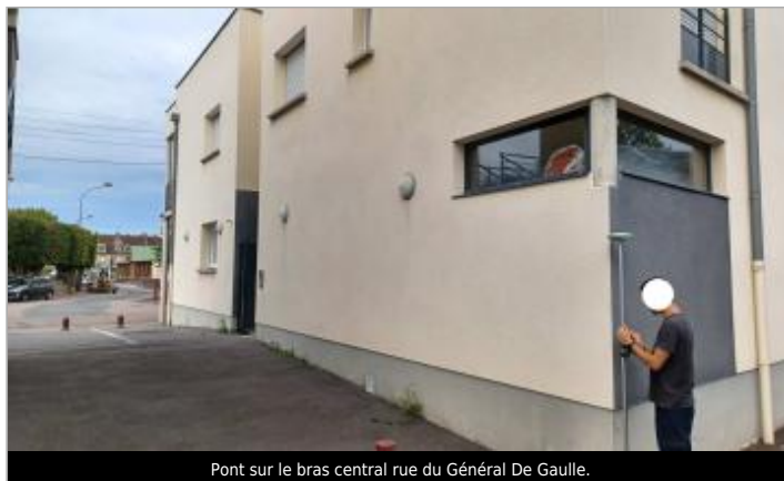
Pont sur le bras central rue du Général De Gaulle.