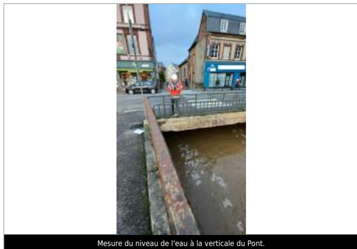
Mesure du niveau de l'eau à la verticale du Pont.

NIVELLEMENT SPC SACN. LE SPC N'EST PAS GÉOMÈTRE EXPERT, LES COTES SONT DONNÉES À TITRES INDICATIF. - 04/01/2022