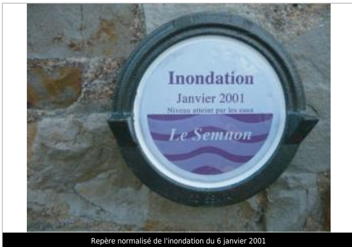
Repère normalisé de l'inondation du 6 janvier 2001

Altitude calculée de l'eau (en m) : 13.457 m