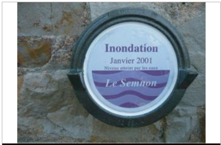
Repère normalisé de l'inondation du 6 janvier 2001

GÉNÉRAL Code : RC_SEMN_4_2001 Date de mise à jour : 06/01/2022 Auteur : SPC VCB