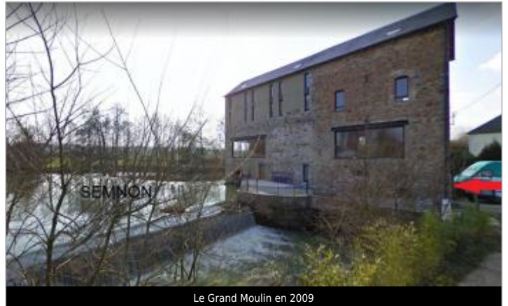
Le Grand Moulin en 2009