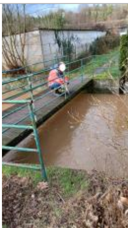
Mesure du niveau de l'eau à la verticale de la passerelle.

NIVELLEMENT SPC SACN. LE SPC N'EST PAS GÉOMÈTRE EXPERT, LES COTES SONT DONNÉES À TITRES INDICATIF. - 04/01/2022