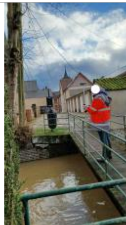
Passerelle piétonne sur bras central, à 100 m de la Médiathèque.