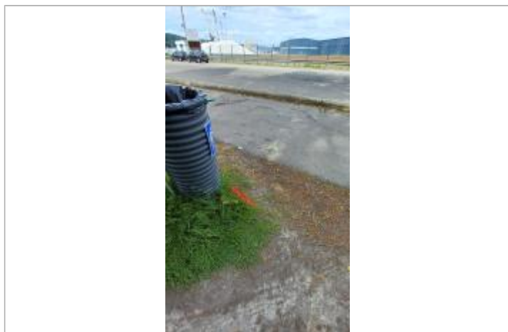
Laisse de crue sur la berge (au sol)

Maximum de l'inondation : Non Visibilité : Oui État du repère : Bon Pérennité : Moyenne