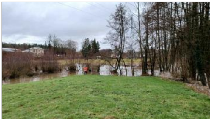
Berge à proximité du "Musée de la Forge" en aval de la chute d'eau.