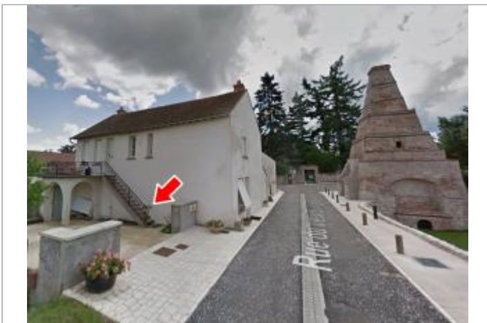
Vue du site en 2014

GÉOLOCALISATION Coordonnées WGS84 : X: 1.87584400 / Y: 47.89233900 Coordonnées RGF93 (Lambert 93) X: 615993.43 / Y: 6755258.56 Coordonnées RGF93 (ETRS89) : X: 1.875844 / Y: 47.892339 Code Hydro: ----0000 Rive de référence: Gauche