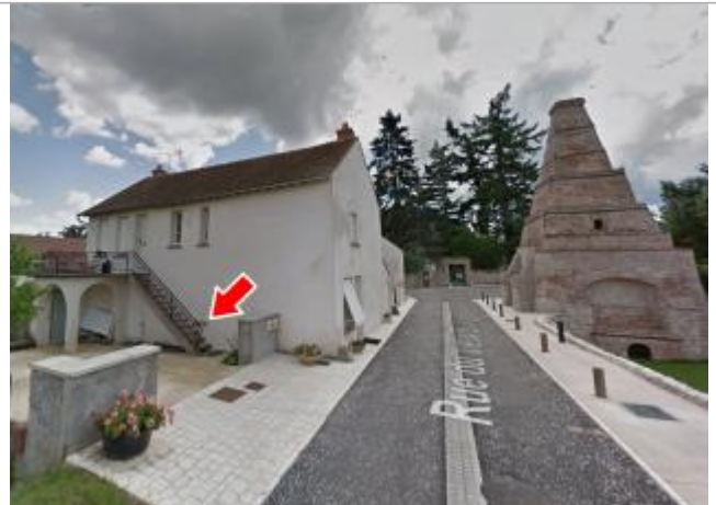
Vue du site en 2014