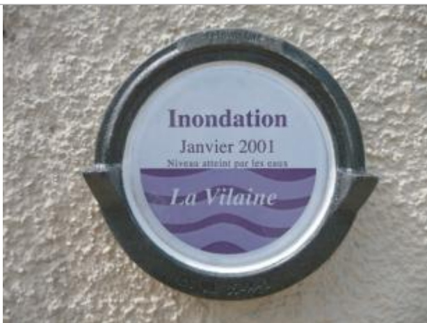
Repère normalisé de l'inondation du 6 janvier 2001

Altitude calculée de l'eau (en m) : 18.51