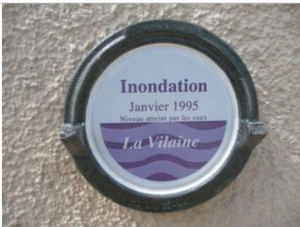
Repère normalisé de l'inondation du 23 janvier 1995

Altitude calculée de l'eau (en m) : 17.96