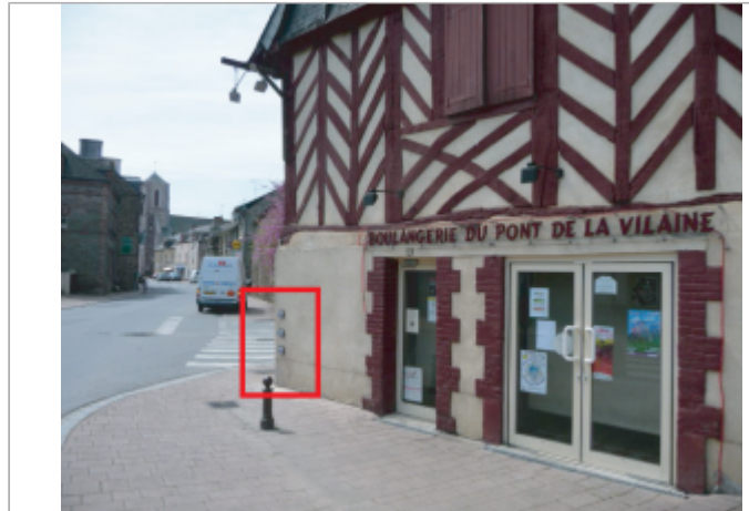
Boulangerie du pont de la Vilaine en 2009 avec repères