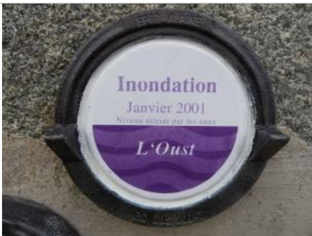
Repère normalisé de la crue de janvier 2001

Altitude calculée de l'eau (en m) : 11.85 m