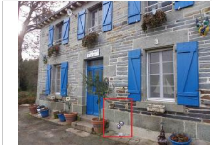
Maison éclusière de Beaumont à Saint-Congard

Coordonnées WGS84 : X: -2.31861230 / Y: 47.78599440