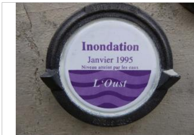
Repère normalisé de la crue de janvier 1995

Altitude calculée de l'eau (en m) : 11.72 m