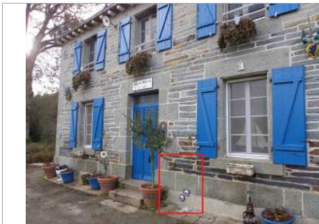
Maison éclusière de Beaumont à Saint-Congard