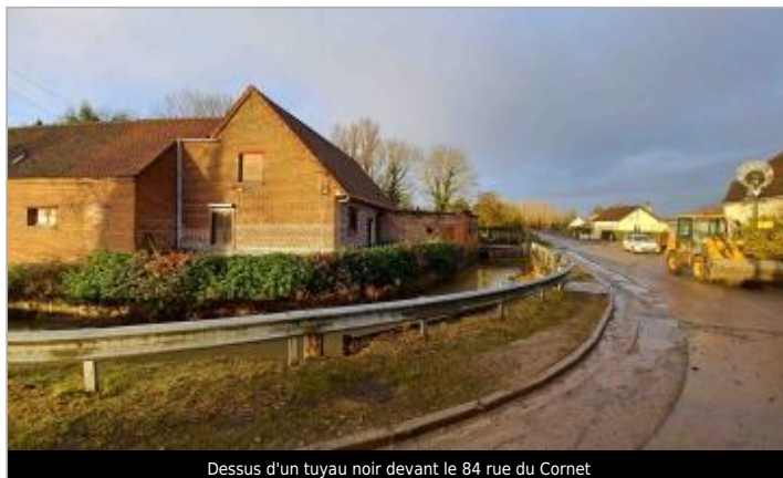
Dessus d'un tuyau noir devant le 84 rue du Cornet