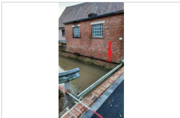
L'eau a atteint le haut du tuyau noir devant le 84 rue du Cornet