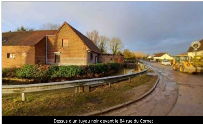
Dessus d'un tuyau noir devant le 84 rue du Cornet