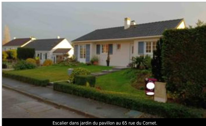
Escalier dans jardin du pavillon au 65 rue du Cornet.