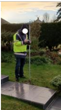
Laisse de débris sur pelouse dans le jardin devant le pavillon.

Altitude calculée de l'eau (en m) : 21.373 m