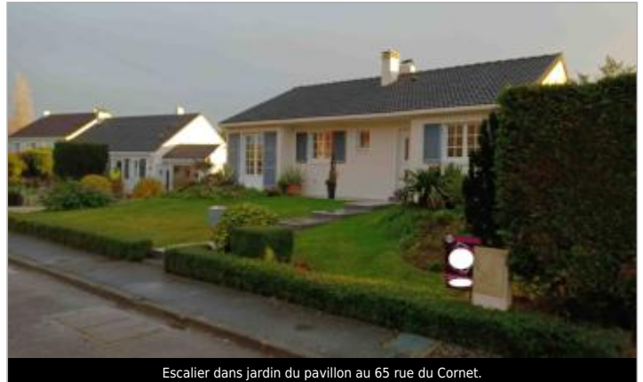
Escalier dans jardin du pavillon au 65 rue du Cornet.