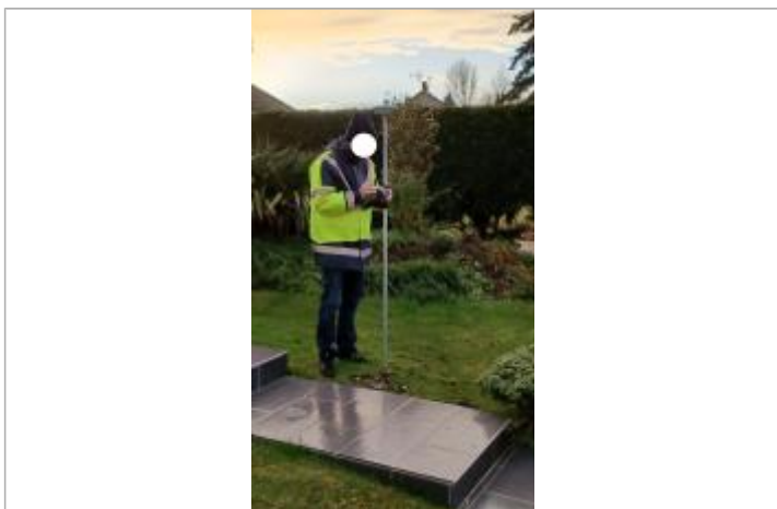
Laisse de débris sur pelouse dans le jardin devant le pavillon.

NIVELLEMENT SPC SACN. LE SPC N'EST PAS GÉOMÈTRE EXPERT, LES COTES SONT DONNÉES À TITRES INDICATIF. - 09/12/2021