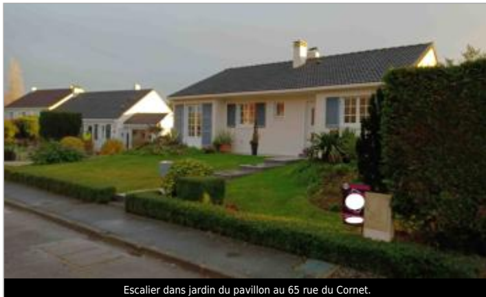
Escalier dans jardin du pavillon au 65 rue du Cornet.