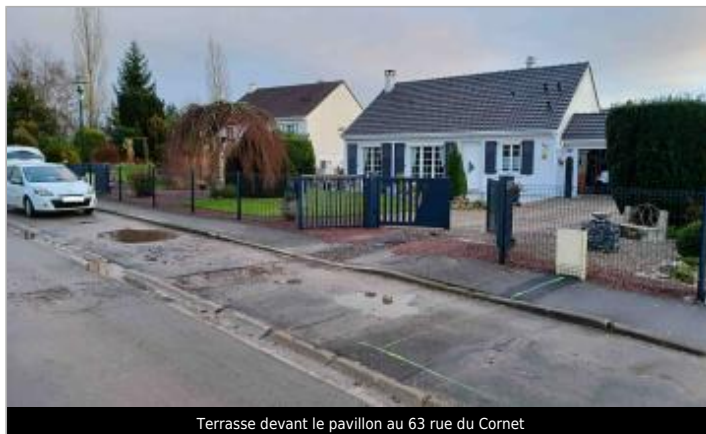
Terrasse devant le pavillon au 63 rue du Cornet