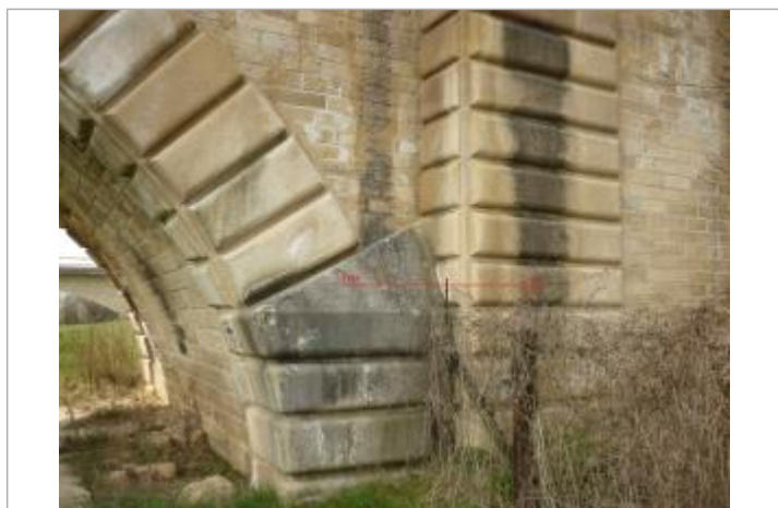
Culée amont du pont SNCF sur l'Armançon

Texte : 1910 Maximum de l'inondation : Oui Visibilité : Oui État du repère : Moyen Pérennité : Longue