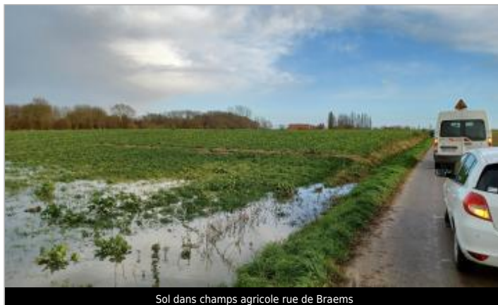
Sol dans champs agricole rue de Braems