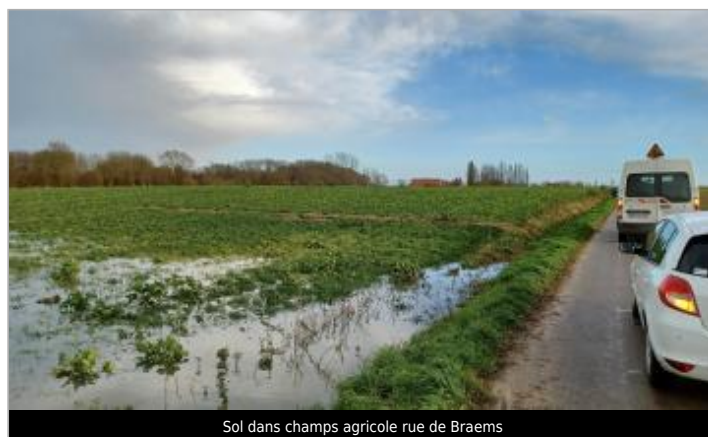
Sol dans champs agricole rue de Braems

GÉOLOCALISATION Coordonnées WGS84 : X: 2.53192560 / Y: 50.89968600 Coordonnées RGF93 (Lambert 93) X: 667004.05 / Y: 7089379.02 Coordonnées RGF93 (ETRS89) : X: 2.5319256 / Y: 50.899686 Code Hydro: E4900570 Rive de référence: Droite