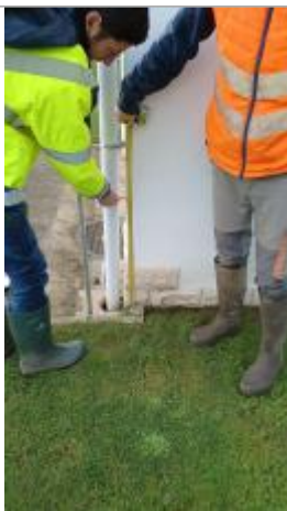
Laisse de crue sur façade Est du pavillon à 62 cm/sol

Altitude calculée de l'eau (en m) : 9.248