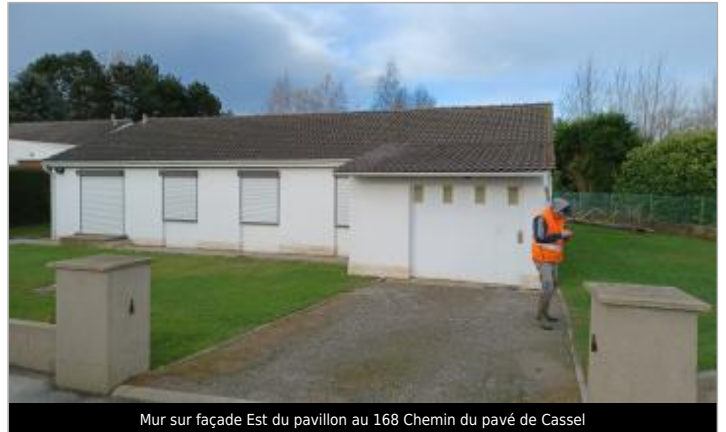
Mur sur façade Est du pavillon au 168 Chemin du pavé de Cassel