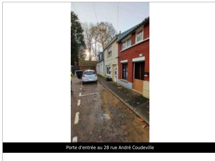
Porte d'entrée au 28 rue André Coudeville