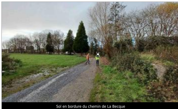
Sol en bordure du chemin de La Becque