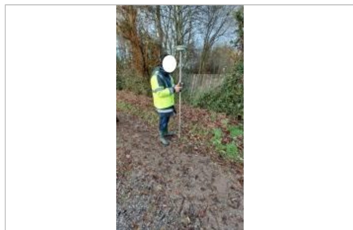
Débris de feuillages au sol