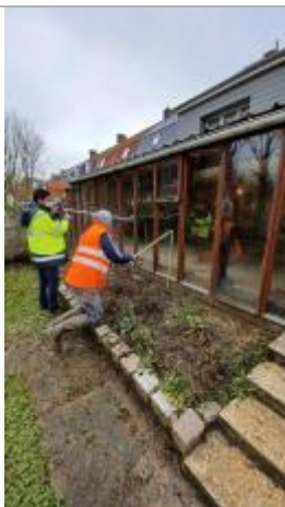
Laisse de crue sur vitre de la véranda à l'arrière de la maison à 91 cm/sol

Altitude calculée de l'eau (en m) : 13.605 m