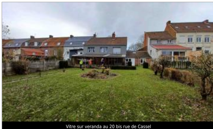
Vitre sur veranda au 20 bis rue de Cassel