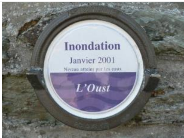
Repère normalisé de la crue de janvier 2001

Altitude calculée de l'eau (en m) : 15.76