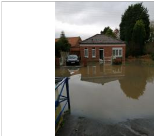
Mur de brique sur façade maison au 48 rue de la Gare

Coordonnées WGS84 : X: 2.42632820 / Y: 50.88643600