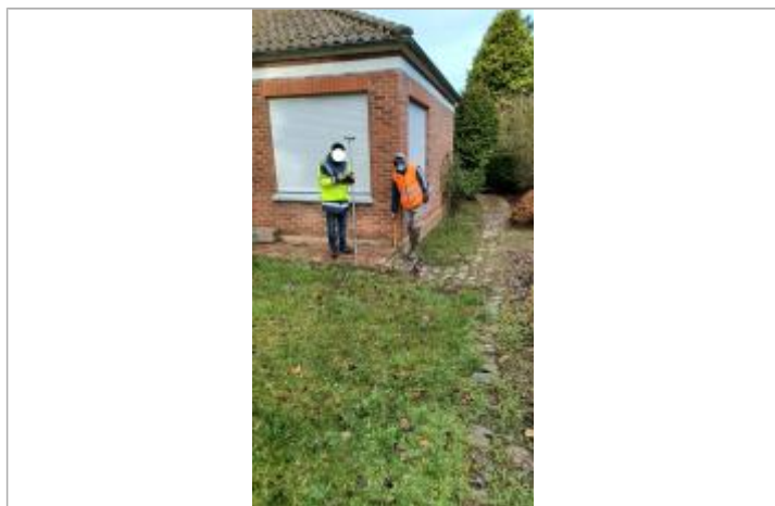
Laisse de crues sur mur de briques sur façade du pavillon à 25 cm du sol