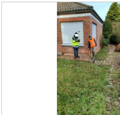
Laisse de crues sur mur de briques sur façade du pavillon à 25 cm du sol