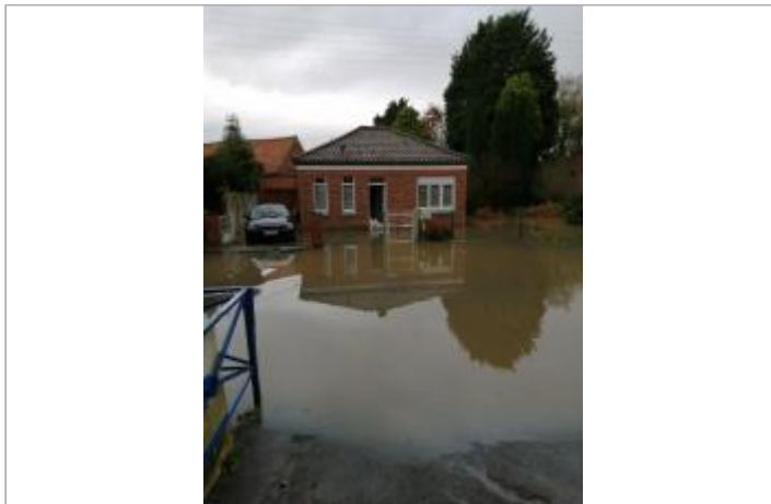
Mur de brique sur façade maison au 48 rue de la Gare