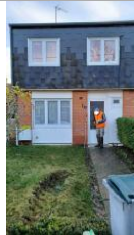
Mur en brique au 1 rue d'Arnèke