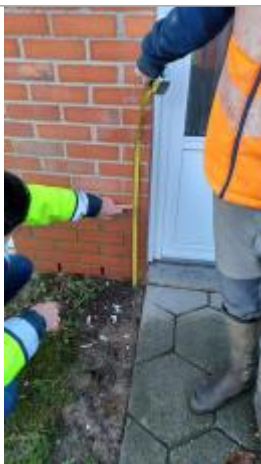
Laisse de crues sur mur de briques sur façade du pavillon à 50 cm/sol

Altitude calculée de l'eau (en m) : 14.332