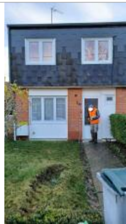
Mur en brique au 1 rue d'Arnèke