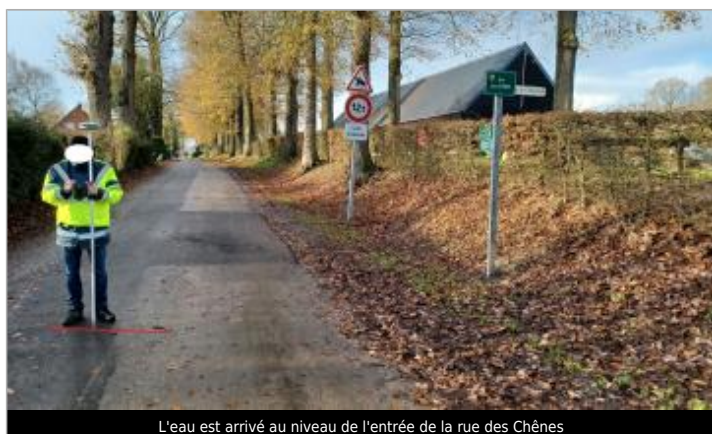
L'eau est arrivé au niveau de l'entrée de la rue des Chênes

Maximum de l'inondation : Oui Visibilité : Non État du repère : Disparu Pérennité : Aucune