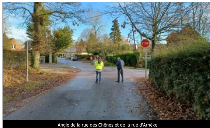
Angle de la rue des Chênes et de la rue d'Arnèke