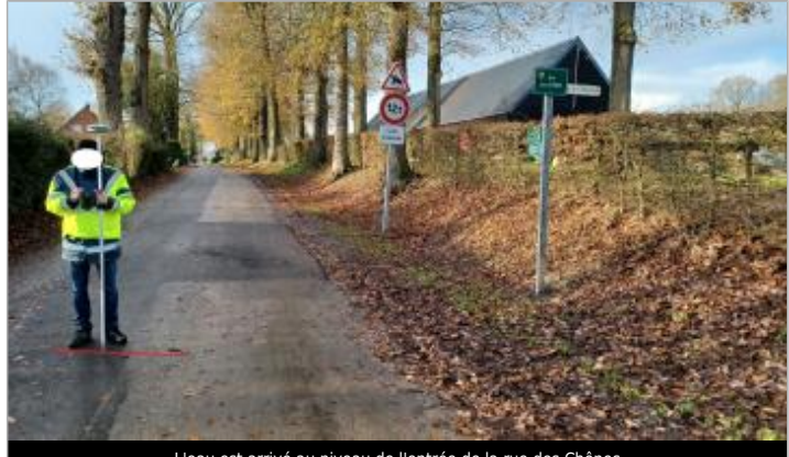
L'eau est arrivé au niveau de l'entrée de la rue des Chênes

MARQUE Maximum de l'inondation : Oui Visibilité : Non État du repère : Disparu Pérennité : Aucune