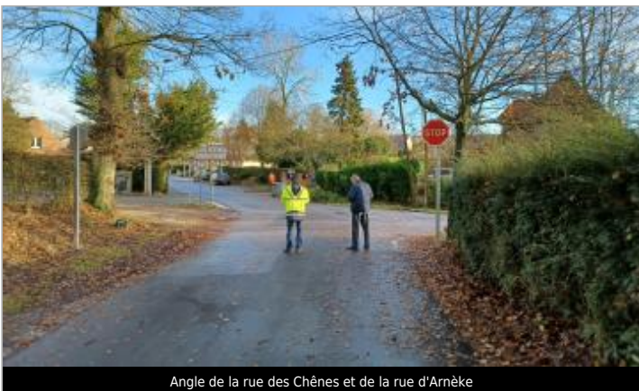
Angle de la rue des Chênes et de la rue d'Arnèke

GÉOLOCALISATION Coordonnées WGS84 : X: 2.43145040 / Y: 50.88378400 Coordonnées RGF93 (Lambert 93) X: 659908.6 / Y: 7087652.91 Coordonnées RGF93 (ETRS89) : X: 2.4314504 / Y: 50.883784 Code Hydro: E4900570 Rive de référence: Droite