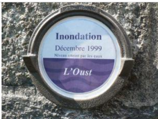
Repère normalisé de la crue de décembre 1999

Altitude calculée de l'eau (en m) : 15.504 m