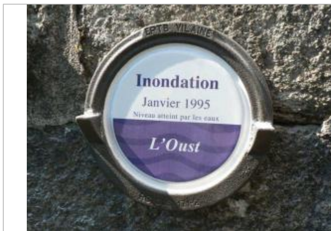
Repère normalisé de la crue de janvier 1995

Altitude calculée de l'eau (en m) : 15.444 m