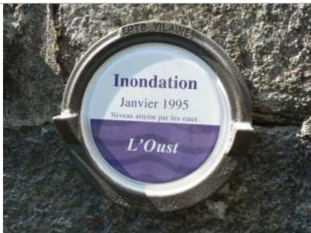
Repère normalisé de la crue de janvier 1995

Altitude calculée de l'eau (en m) : 15.444 m