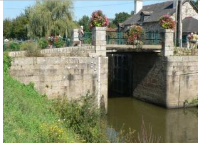
ecluse n°25 de Malestroit - échelle aval

Coordonnées WGS84 : X: -2.38281470 / Y: 47.81199560