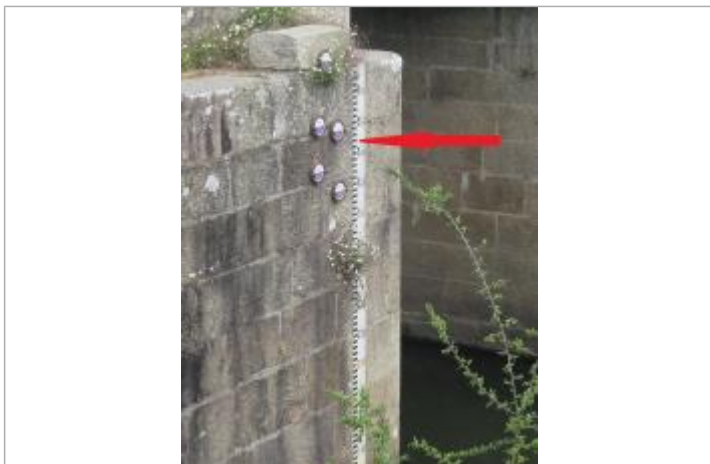
Echelle limnimétrique - crue décembre 2000

Altitude calculée de l'eau (en m) : 15.344 m