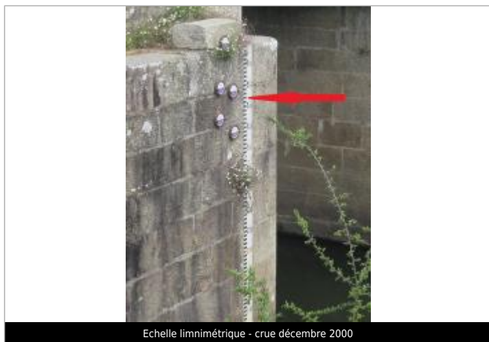
Echelle limnimétrique - crue décembre 2000

Altitude calculée de l'eau (en m) : 15.344 m