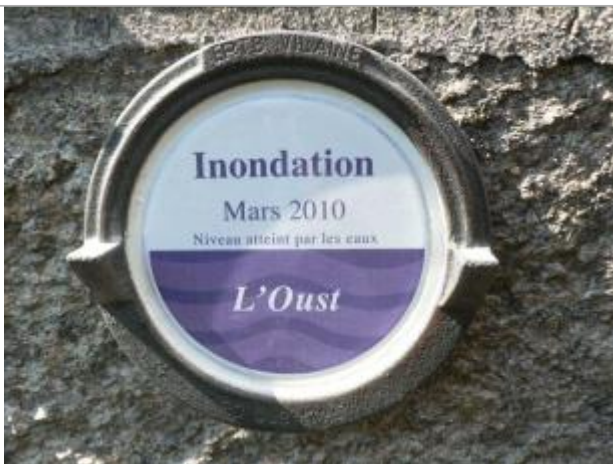
Repère normalisé de la crue de novembre 1930

Altitude calculée de l'eau (en m) : 15.224 m