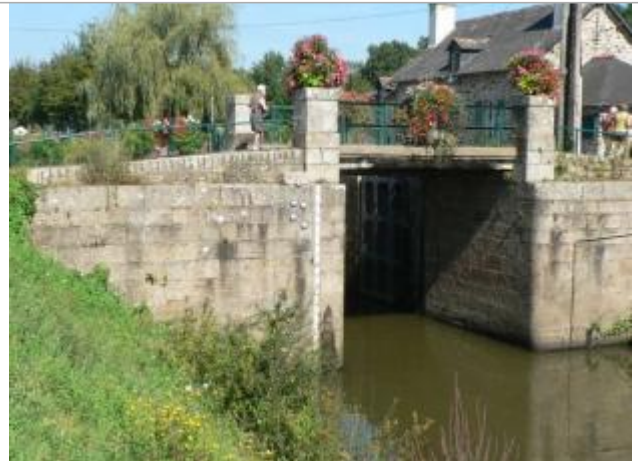
ecluse n°25 de Malestroit - échelle aval

Coordonnées WGS84 : X: -2.38281470 / Y: 47.81199560