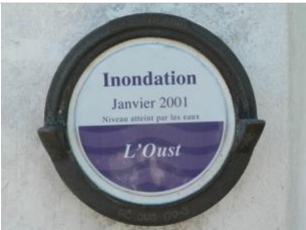
Repère normalisé de la crue de janvier 2001

Altitude calculée de l'eau (en m) : 15.68 m