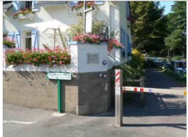
Mur de la propriété au 2 rue Madame à Malestroit

Coordonnées WGS84 : X: -2.38145710 / Y: 47.81040300