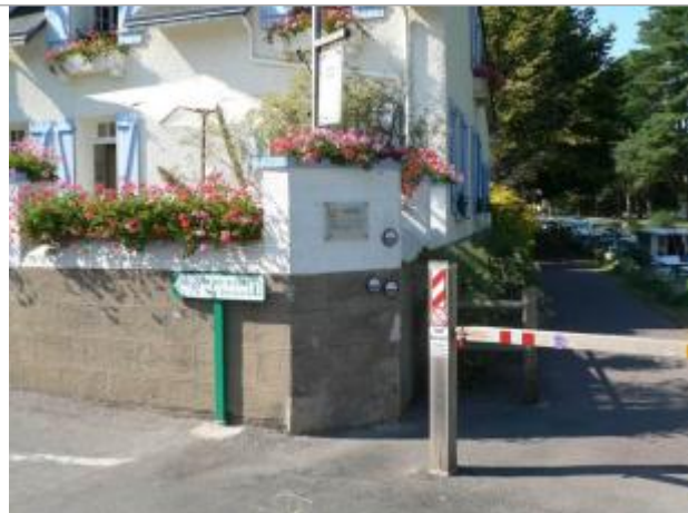
Mur de la propriété au 2 rue Madame à Malestroit