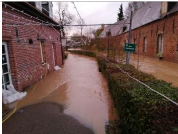
Porte de service du restaurant dans Allée Traversière