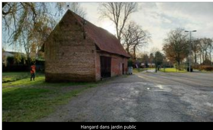
Hangard dans jardin public