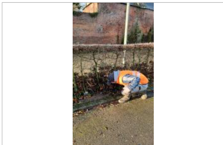
Laisse de débris de végétaux sur la haie en fer à 62 cm/sol.

NIVELLEMENT SPC SACN. LE SPC N'EST PAS GÉOMÈTRE EXPERT, LES COTES SONT DONNÉES À TITRES INDICATIF. - 08/12/2021