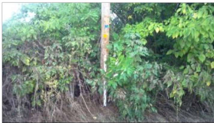
Photo du repère