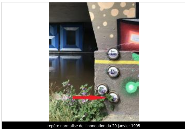
repère normalisé de l'inondation du 20 janvier 1995