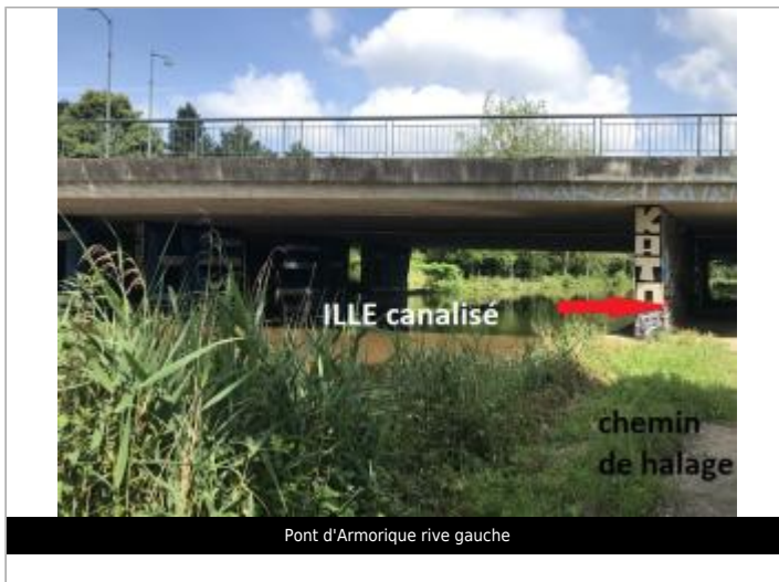
Pont d'Armorique rive gauche