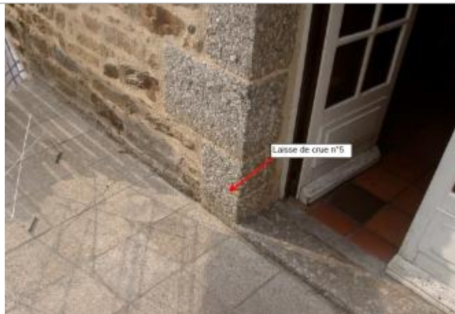
Entrée de la maison, photographie de 2003 lors du relevé par BCEOM