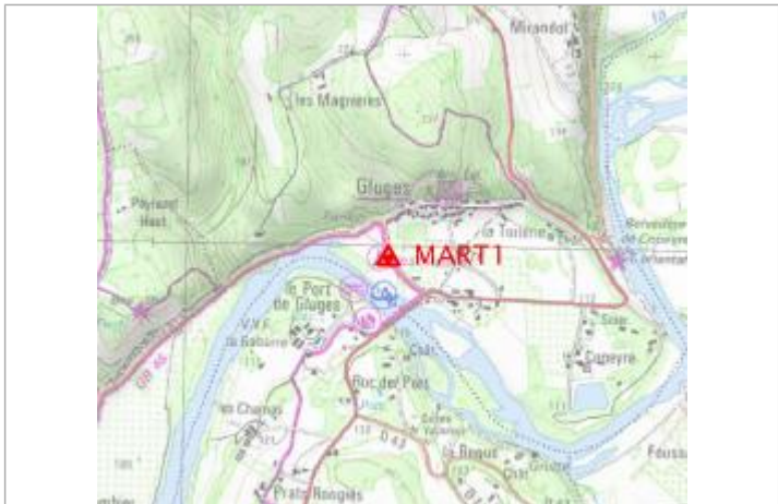
Localisation carte IGN

GÉNÉRAL Code : MART1 Date de mise à jour : 10/02/2022 Auteur : gremminger