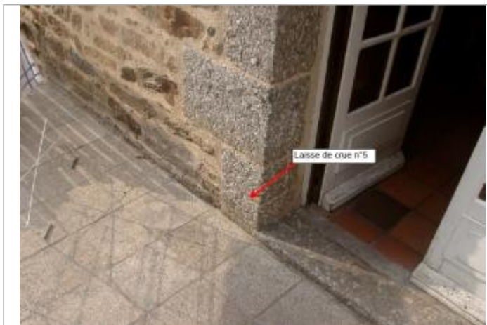
Entrée de la maison, photographie de 2003 lors du relevé par BCEOM