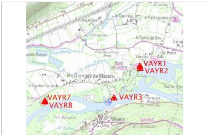
Localisation carte IGN

SOURCE DE REPÉRAGE : DDT 46 - 10/02/2021 Type de repérage : Campagne de terrain post-inondation