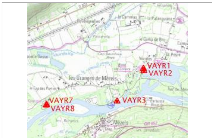
Localisation carte IGN