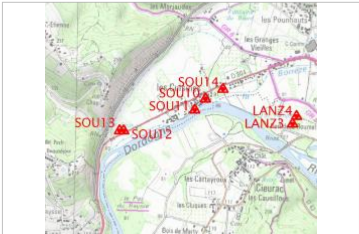
Localisation carte IGN

GÉNÉRAL Code : LANZ4 Date de mise à jour : 10/02/2022 Auteur : gremminger