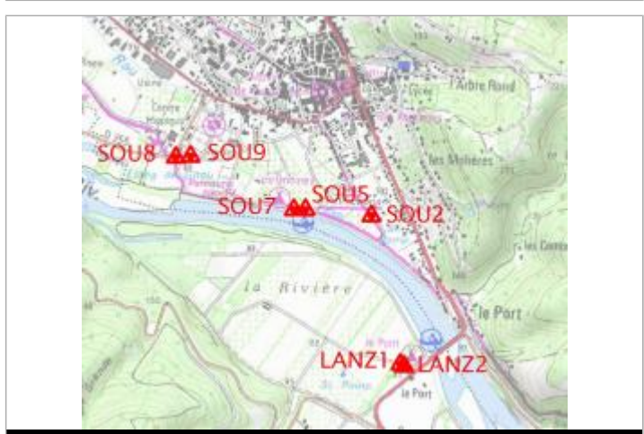
Localisation carte IGN

GÉNÉRAL Code : LANZ2 Date de mise à jour : 10/02/2022 Auteur : gremminger